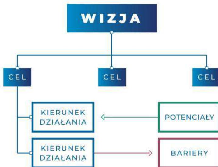
Rys. 1 Logika interwencji Strategii