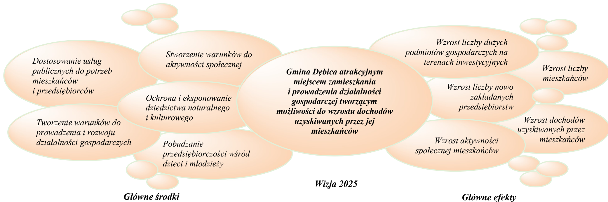
Rysunek 2 Drzewo celów